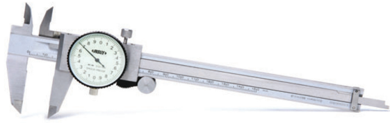
Mekanik Saatli Kumpas