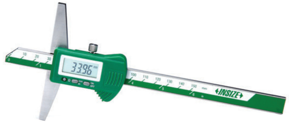
Dijital Derinlik Kumpası