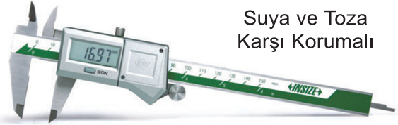
Suya ve Toza Karşı Korumalı